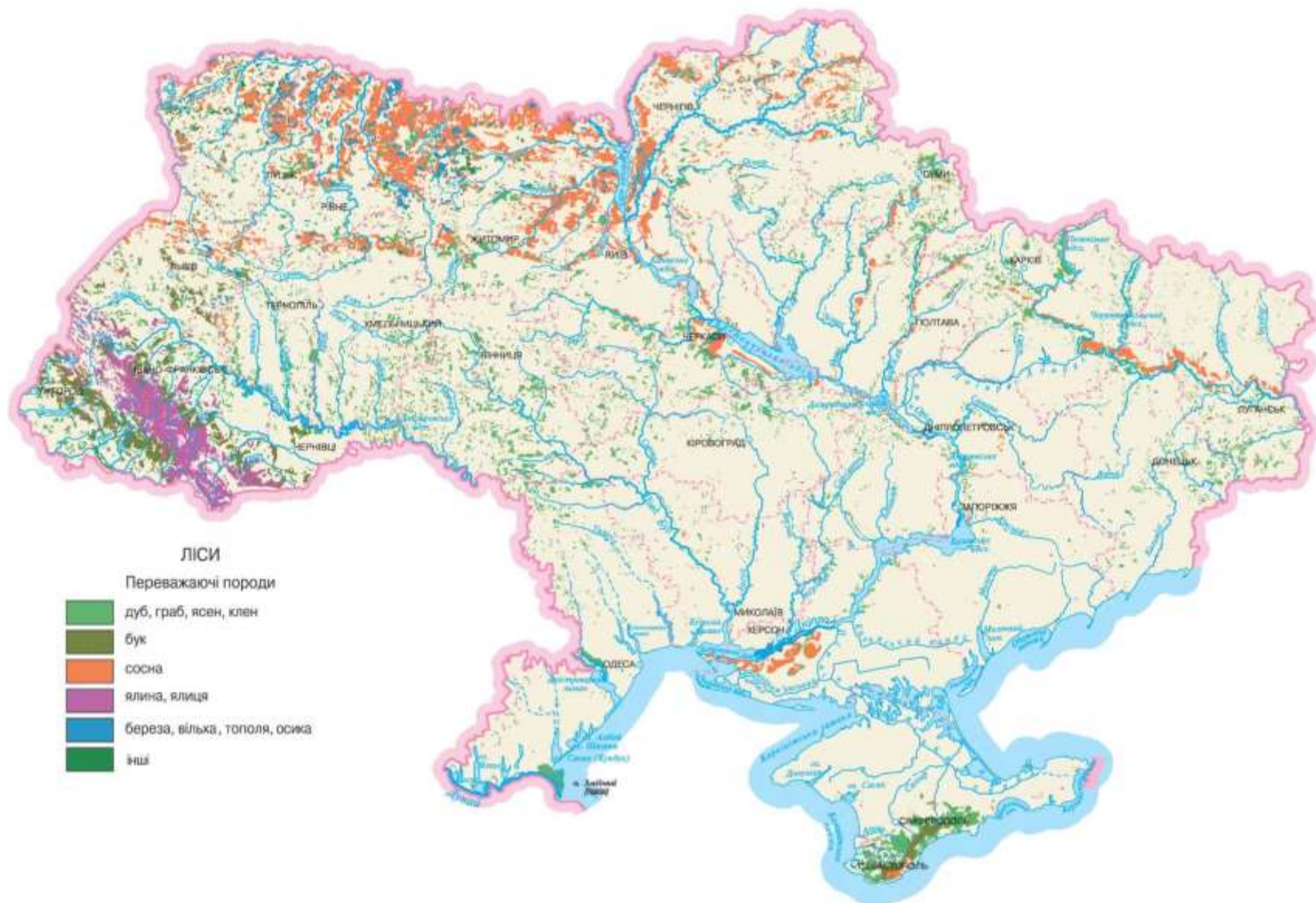
Рисунок 1. Поширення лісів України (за матеріалами лабораторії нових інформаційних технологій УкрНДІЛГА)